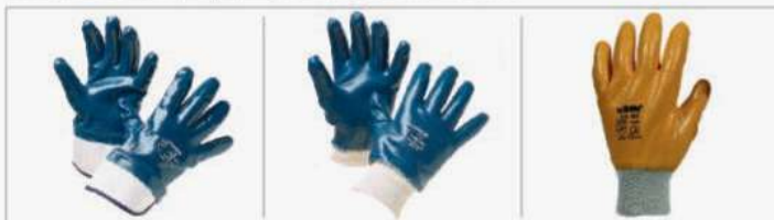
Nitrilo azul pesado, puño de seguridad

Aplicaciones: Manejo de ladrillos, estructuras en madera, hormigón, cables gruesos de cobre, estructuras de acero, chapa, lata y otros objetos metálicos, etc.