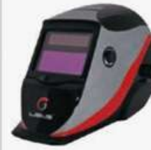
Careta de soldador fotosensible DIN DE 9 A 13