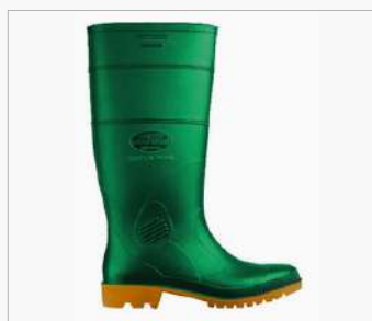
BOTA PVC HIDROCARBUROS