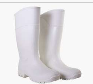
BOTA BLANCA CON PUNTERA