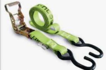
SUJECIÓN DE CARGAS