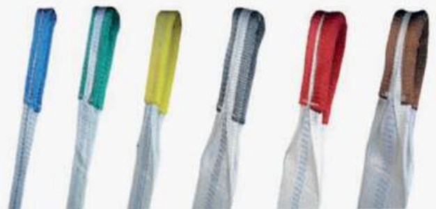
ESLINGAS FABRICADAS PARA SOPORTAR CARGAS DE 1, 2, 3, 4, 5 Y 6 TONELADAS