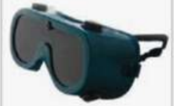
Antiparra de soldador