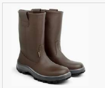
BOTA PETROLERA GEA