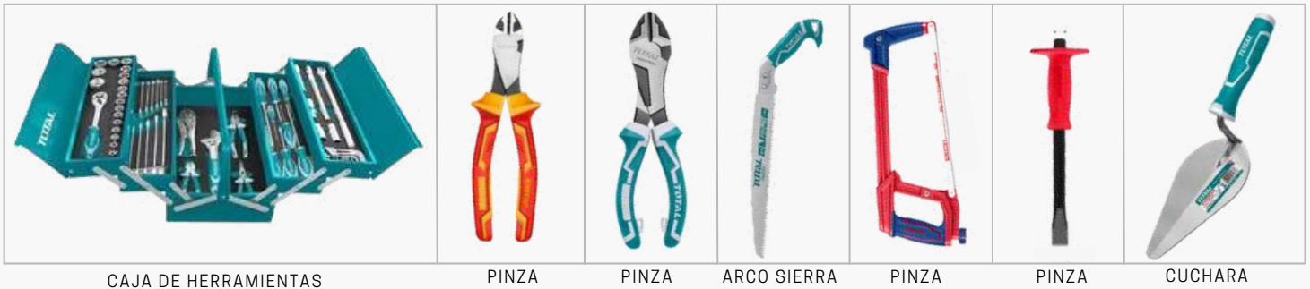
CAJA DE HERRAMIENTAS

Contamos con gran variedad de herraminetas, en cada una de sus categorías: Manual, Eléctrica, De explosión, Jardinería, Pinturas, Carros y Zorras. Trabajamos con las marcas Emtop y Total, ambas cuentas con la mejor calidad y precio del mercado.