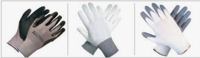
Nylon G13 | Látex rugoso

Para tareas generales que requieran tacto, grip tanto en seco como en mojado, destreza, repelencia a líquidos, durabilidad, resistencia mecánica y al corte, respirabilidad gracias a su dorso ventilado y reducción de fatiga muscular en las manos. Con base de nylon o algodón y distintos recubrimientos. Vienen en distintas combinaciones de colores y talles. Consultar.