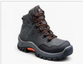
BOTÍN RANDEr GRAY