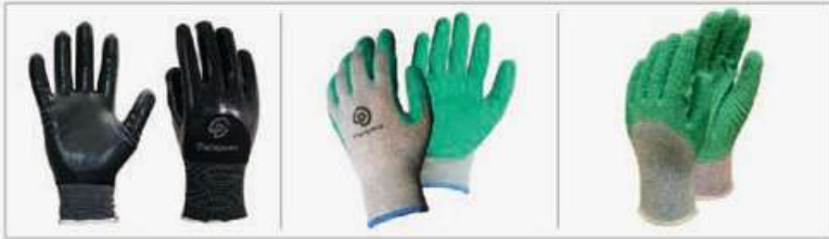
Nylon G13 | Nitrilo baño 3/4