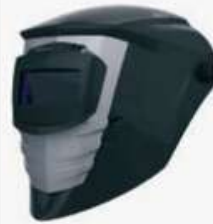
Careta de soldador visor móvil