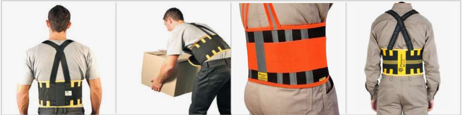
CON VELCRO, SUPER ADHERENTE.

Faja lumbar 100% elastizada. Confeccionada con banda cuerpo central de elástico ribeteado con 6 ballenas flexibles, antideslizante y ajuste con cierre abrojo. Elástico de ajuste de tensión con cierre abrojo. Tiradores elásticos con hebillas regulables. CALIDAD GARANTIZADA.