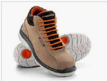
BOTITA FUNCIONAL CAPR