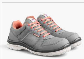
ZAPATILLA MOD. MAUI GRAY