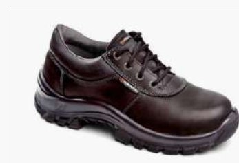
ZAPATO SPIDER CUERO