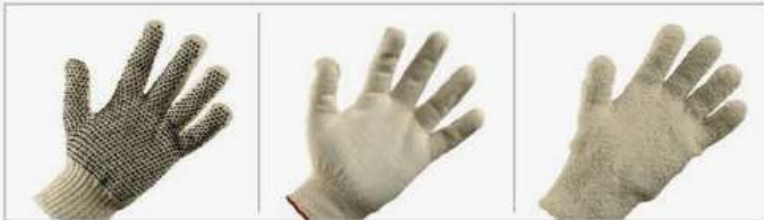
Moteado PVC puro